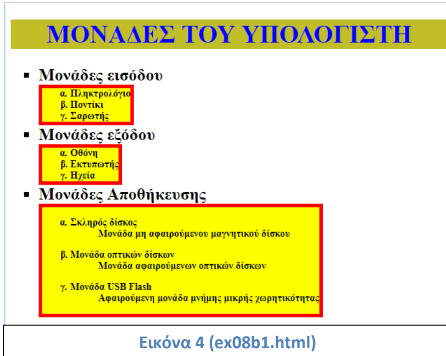
Εικόνα 4 (ex08b1.html)

Να αποθηκεύσετε τα αρχεία ex08a.html και ex08a.css ως ex08b1.html και ex08b.css και να πραγματοποιήσετε σε αυτά τις κατάλληλες αλλαγές ώστε η ιστοσελίδα να εμφανίζεται όπως φαίνεται στην εικόνα 4.